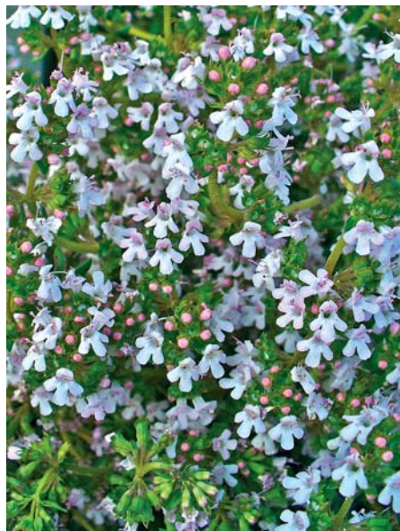
Thymian ist eine anspruchslose Pflanze, die sich als Gewürz und als Heilkraut nutzen lässt. Außerdem ist sie bei Bienen beliebt.

Im Mittelalter wurde Thymian als Haluzinogen bei religiösen Ritualen verwendet. Das Einatmen der Blüte kann allerdings zu einer verzögerten Reaktionsgeschwindigkeit und beeinträchtigter Wahrnehmung führen.