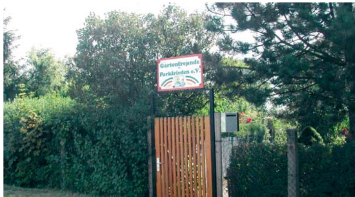
Nur 21 von einst 483 Gärten entgingen dem Bau von Grünau. Die Anlage des KGV „Gartenfreunde Parkfrieden“ zählt damit zu den kleinsten in Leipzig.

Über evtl. Kriegsschäden in beiden Anlagen ist nichts bekannt. Im No-