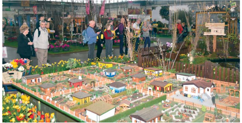
Zum abwechslungsreich und informativ gestalteten Stand der Leipziger Kleingärtner gehört auch in diesem Jahr das Modell einer Kleingartenanlage.