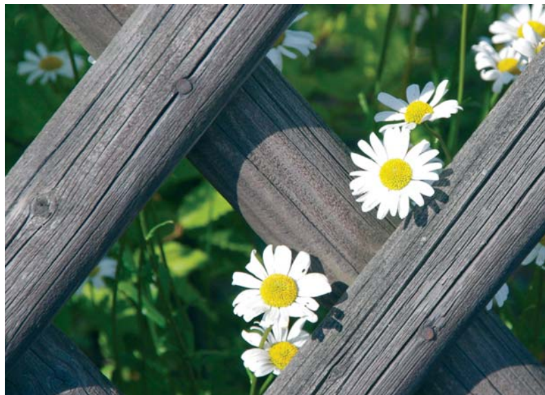
Vor dem Aufstellen eines Zaunes sollte die KGO zu Rate gezogen werden.

Die KGV sind berechtigt, die KGO entsprechend der Besonderheiten ihrer Kleingartenanlage zu modifizieren. Die Modifizierungen dürfen dieser KGO nicht widersprechen. -gm