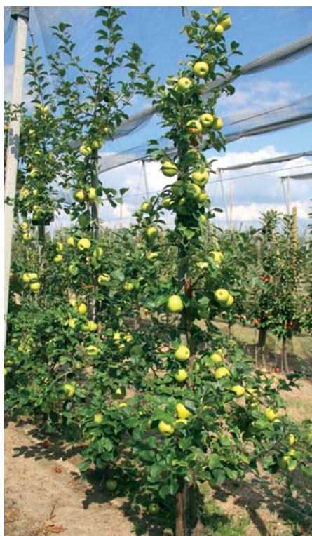
Die Bäume der Apfelsorte Pia41 erwiesen sich im Versuchsanbau als widerstandsfähig gegen den Apfelschorf.

Die Sorte blüht mittelfrüh und ist Anfang Oktober reif. Damit zählt sie zu den späten Herbstäpfeln und wird etwas später geerntet als Elstar oder Gala, aber früher als Braeburn. Die