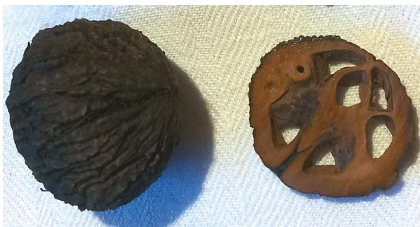
Das Innere der aufgeschnittenen Nuss.

Das Innere der Nuss ist essbar. Der Geschmack scheint gewöhnungsbedürftig zu sein. Zum Teil wird er als angenehm beschrieben mit einem wunderbaren Aroma, vielseitig einsetzbar und delikat. Doch es gibt auch Meinungen, die ihn als muffig bezeichnen.