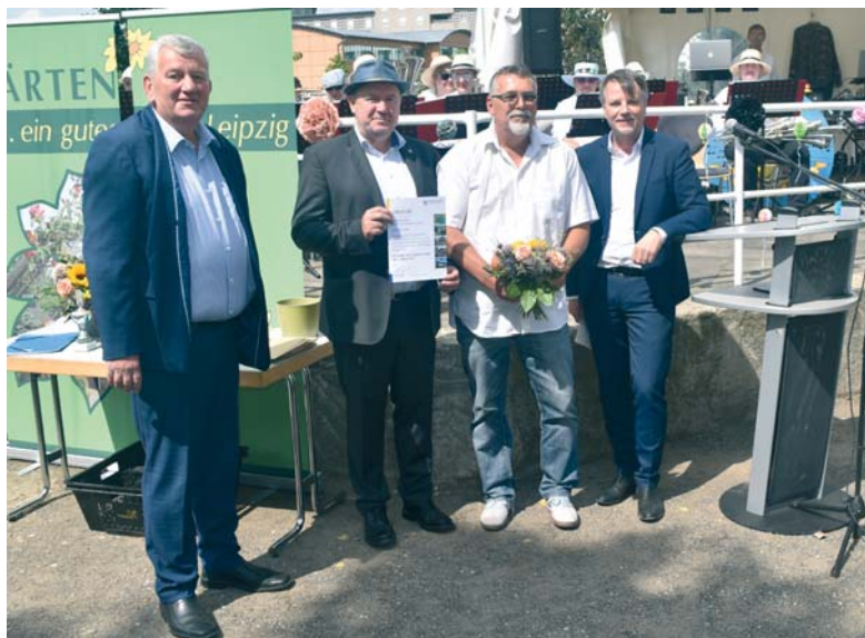
2023 gewann der KGV „Kultur“ e.V. mit seiner Anlage in der Kategorie 3 des Wettbewerbes.

Erfahrungsgemäß wird sich an der Durchführung nichts Gravierendes ändern. Die Bewertung der Teilnehmer in drei Größenkategorien (s. Kasten) hat sich bewährt und wird voraussichtlich auch 2025 beibehalten. Zur Vorbereitung der Vereine sind die Kriterien des Wettbewerbes von 2023 (s. Kasten) eine wertvolle Hilfe. Auch hier gilt: „Zeitiger Anfang erhöht die Aussicht auf Erfolg.“ So kann noch